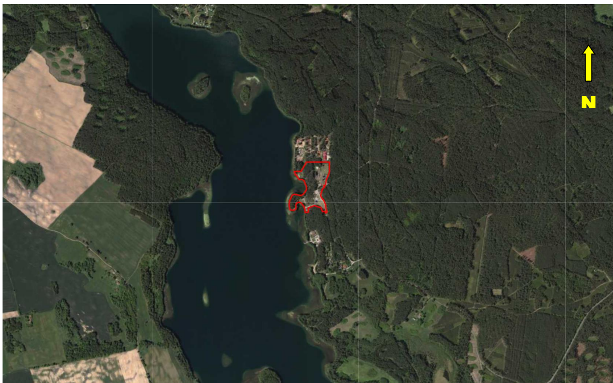
Ryc.1. Mapa sytuacyjna z lokalizacją terenu objętego opracowaniem ( http://maps.geoportal.gov.pl ).

Zakres analizy obejmuje obszar o powierzchni ok. 5,2281 ha, wyznaczony uchwałą nr XXXI/229/2021 Rady Gminy Sorkwity z dnia 20 sierpnia 2021 r. w sprawie przystąpienia do sporządzenia zmiany miejscowego planu zagospodarowania przestrzennego terenu ośrodka szkoleniowo-wypoczynkowego w obrębie Borowski Las, gmina Sorkwity.