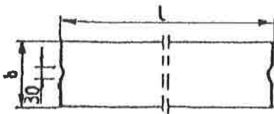
Rys. 1. Wymiarowanie krawężników